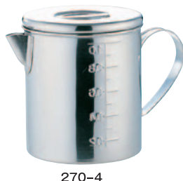
②モリブデンソース差し 270-4 1000cc φ105×130mm ¥4,200 270-5 500cc φ 94× 98mm ¥3,000