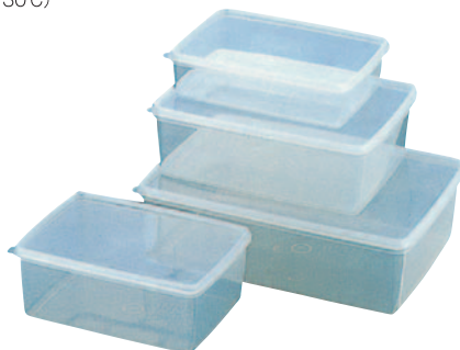
S-132 271×201×H 45mm 1,800ml ¥810 S-133 335×241×H 52mm 3,100ml ¥1,140 S-134 365×270×H 55mm 4,100ml ¥1,340 S-138 398×298×H 56mm 5,000ml ¥1,620 S-139 475×330×H 80mm 10,000ml ¥2,330 ●サイズ豊富で用途が広い。 ●便利な中身の見える保存容器。