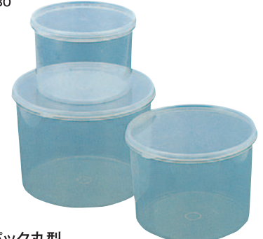
⑧ハイバック丸型 ●材質:本体/ポリプロピレン(耐熱温度/120℃・耐冷温度/-20℃) フタ/ポリエチレン(耐熱温度/60℃・耐冷温度/-30℃) S-40 φ110×H 32mm 200ml ¥210 S-41 φ140×H 40mm 420ml ¥250 S-42 φ157×H 52mm 730ml ¥310 S-60 φ110×H 66mm 490ml ¥240 S-61 φ140×H 80mm 900ml ¥300 S-62 φ157×H113mm 1,700ml ¥510 S-65 φ187×H140mm 3,000ml ¥690 S-66 φ218×H162mm 4,900ml ¥890 S-70 φ 80×H 93mm 300ml ¥270 S-71 φ 90×H128mm 540ml ¥300 S-75 φ 90×H303mm 1,350ml ¥580