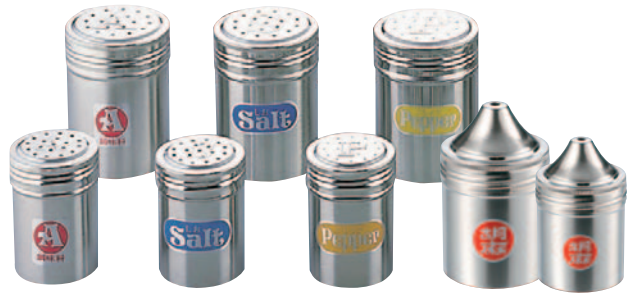
③18-8調味缶 27C-AL A缶 大 φ70×H95mm ¥1,000 27C-AS A缶 小 φ55×H80mm ¥880 27C-SL S缶 大 φ70×H95mm ¥1,000 27C-SS S缶 小 φ55×H80mm ¥880 27C-PL P缶 大 φ70×H95mm ¥1,000 27C-PS P缶 小 φ55×H80mm ¥880 ④18-8調味缶ゴマ缶 27C-GL 大 φ70×H117mm ¥1,240 27C-GS 小 φ55×H 88mm ¥1,000 ●材質:18-8ステンレス