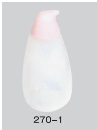
①ソース差し 270-1 350cc ¥450 ポリエチレン