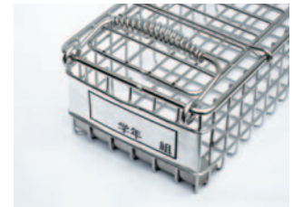
アルミニウムプレート1枚付