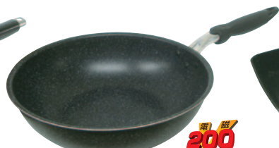
⑥IHマーブルコートいため鍋 380-LM 28cm ¥3,800 ●材質:アルミマーブルコート