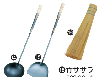
⑮竹ササラ 588-03 小 ¥1,000 18cm φ33×180mm