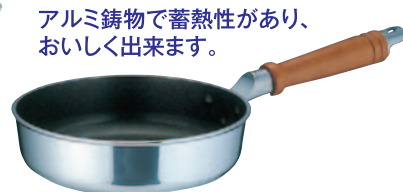
④アルミコートマイスターフライパン (テフロンプラチナ) 583-01 20cm ¥4,000 583-02 22cm ¥4,700 583-03 24cm ¥5,300 583-04 26cm ¥5,800 583-05 28cm ¥6,800 583-06 30cm ¥8,200 583-07 33cm ¥10,000