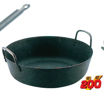
⑪鉄揚げ鍋 ※520-K 20cm 深さ 65mm ¥3,900 ※521-K 22cm 67mm ¥4,300 522-K 24cm 70mm ¥4,300 523-K 27cm 73mm ¥4,800 524-K 30cm 82mm ¥5,900 525-K 33cm 86mm ¥6,800 526-K 36cm 88mm ¥8,700 527-K 39cm 92mm ¥10,800 528-K 42cm 103mm ¥13,400 529-K 45cm 120mm ¥15,500 530-K 51cm 135mm ¥26,000 ※板厚:3.2mm ※20・22cmはIH非対応