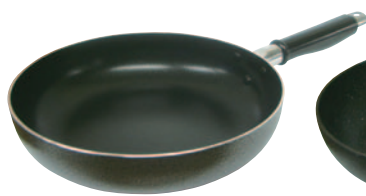
①テフロンフライパン 380-P 24cm ¥2,500 380-Q 26cm ¥3,000 ●材質:アルミテフロン加工