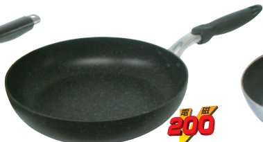
②IHマーブルコートフライパン 380-SM 20cm ¥2,400 380-PM 22cm ¥2,600 380-TM 24cm ¥2,800 380-QM 26cm ¥3,100 380-RM 28cm ¥3,600 ●材質:アルミマーブルコート