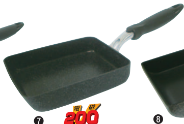
⑦IHマーブルコート玉子焼 380-KM 中 180×130×H35mm ¥2,800 ●材質:アルミマーブルコート