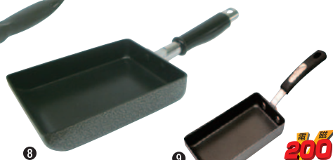
⑨IHスリム玉子焼 380-T ¥3,000 焼き部分/185×90×H30mm 全長340mm 質量400g ※特殊サイズですので玉子1個で ふっくら厚焼き玉子が作れる IH調理器対応たまご焼き器