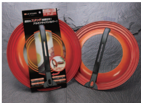
⑱ル・スタンド FPK-C M 22-24-26cm用 275×80mm 455g ¥1,800 FPK-D L 26-28-30cm用 315×85mm 575g ¥2,000 ●材質:本体/アルミ合金+フッ素コーティング ガラス:物理強化ガラス ハンドル:フェノール樹脂 ※注意事項:フライパン形状により一部適合しない場合がございます。