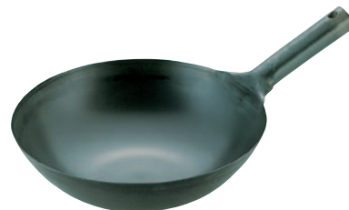
⑬鉄中華片鍋 525-G 27cm 深さ 80mm ¥3,500 526-G 30cm 90mm ¥3,900 527-G 33cm 100mm ¥4,500 528-G 36cm 110mm ¥5,200 529-G 39cm 120mm ¥6,000