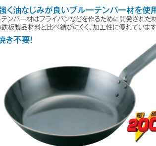
⑩ブルーイング鉄フライパン 柄の長さ 高さ BTN-16 16cm 145×32mm ¥1,350 BTN-18 18cm 165×35mm ¥1,450 BTN-20 20cm 180×40mm ¥1,600 BTN-22 22cm 205×43mm ¥1,800 BTN-24 24cm 223×47mm ¥2,000 BTN-26 26cm 255×50mm ¥2,300 BTN-28 28cm 270×53mm ¥2,900 BTN-30 30cm 293×53mm ¥3,350 BTN-32 32cm 305×55mm ¥3,800 BTN-34 34cm 340×60mm ¥4,400 BTN-36 36cm 380×65mm ¥5,100 BTN-40 40cm 435×65mm ¥6,500 BTN-45 45cm 450×75mm ¥8,000 ※板厚:16~40cm...1.6mm/45cm...2.3mm ※SGマーク認定商品(18~30cmまで)

錆に強く油なじみが良いブルーテンパー材を使用。 ブルーテンパー材はフライパンなどを作るために開発された材料 で他の鉄板製品材料と比べ錆びにくく、加工性に優れています。 カラ焼き不要!