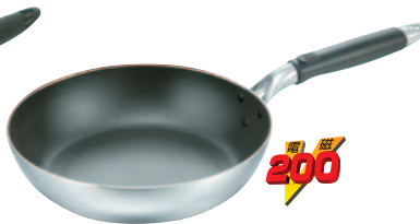
③IHミラーフライパン 584-05 20cm ¥2,150 584-06 24cm ¥2,450 584-07 26cm ¥2,650 584-08 28cm ¥2,850 584-09 30cm ¥3,200 ●材質:アルミニウム