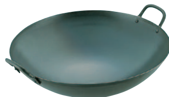
⑫鉄中華鍋 525-L 27cm 70mm ¥2,400 526-L 30cm 75mm ¥2,700 527-L 33cm 85mm ¥3,300 528-L 36cm 95mm ¥4,000 529-L 39cm 105mm ¥4,600 530-L 42cm 115mm ¥5,000 531-L 45cm 125mm ¥6,500 532-L 48cm 140mm ¥9,500 533-L 51cm 150mm ¥11,000 534-L 54cm 170mm ¥15,000 535-L 57cm 180mm ¥16,500 536-L 60cm 190mm ¥18,500