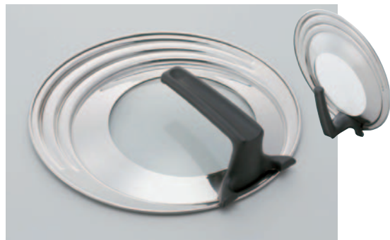
⑰ロックインスタンドカバー 適応サイズ FPK-S S 18cm~22cm ¥3,500 FPK-M M 22cm~26cm ¥3,800 FPK-L L 26cm~30cm ¥4,500 ※丈夫でさびにくいステンレス製。 ※場所をとらない自立式フライパンカバー。 ※強化ガラス