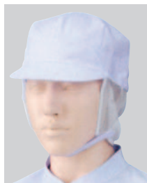
④484-43 2枚入 (八角帽子・サイドメッシュ付) ¥2,600 サイズ:フリー(最大61cmまで)