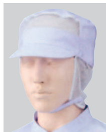
⑤484-44 2枚入 (丸天帽子・フロント・サイドメッシュ付) ¥2,600 サイズ:フリー(最大62cmまで)