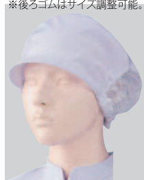
⑥482-33 2枚入 (女子帽子・後ろメッシュ付) ¥2,600 サイズ:フリー(最大65cm)