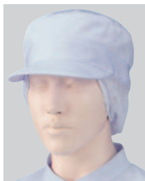
③484-49 2枚入 (丸天帽子・サイドメッシュ付) ¥2,600 サイズ:フリー