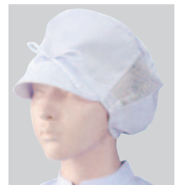
⑧484-30 2枚入 (作業帽子・メッシュ付) ¥2,800 サイズ:フリー(最大60cmまで)