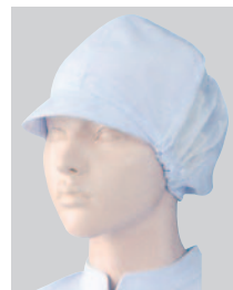
⑦482-32 2枚入 (女子帽子・6枚ハギ・メッシュ付) ¥3,000 サイズ:フリー(最大65cm)