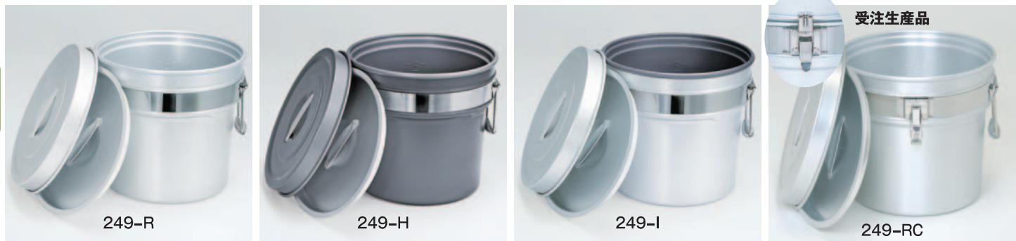
①シルバーアルマイト ②内外超硬質ハードコートアルマイト仕上 ③内側超硬質ハードコートアルマイト仕上 ④段付二重食缶クリップ・シリコンパッキン付