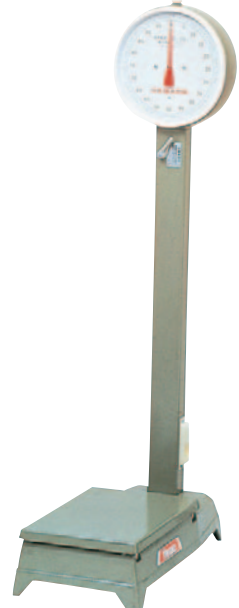
⑪自動台秤(中型) D-20MZ 20kg(1目盛50g)車付 ¥173,000 D-20M 20kg(1目盛50g)車無 ¥168,000 D-50MZ 50kg(1目盛100g)車付 ¥165,000 D-50M 50kg(1目盛100g)車無 ¥160,000 D-100MZ 100kg(1目盛100g)車付 ¥165,000 D-100M 100kg(1目盛100g)車無 ¥160,000 ●全高:1,255mm ●本体重量:22kg ●載台寸法:375×260mm ●目盛板外径:φ287mm