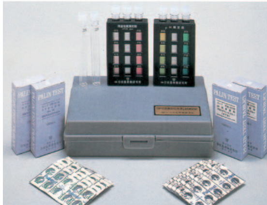
②DPD法残留塩素兼pH測定器(ブレイクス入) N-21196 ¥31,000 測定範囲:単位ppm(mg/l) 0.1、0.2、0.4、0.7、1.0、1.5、2.0、3.0 pH6.0、6.2、6.4、6.6、6.8、7.0、7.2、7.4 内 容:DPDコンバーター1、pHコンバーター1、比色セル10、DPD法錠剤200錠、pH錠剤200錠