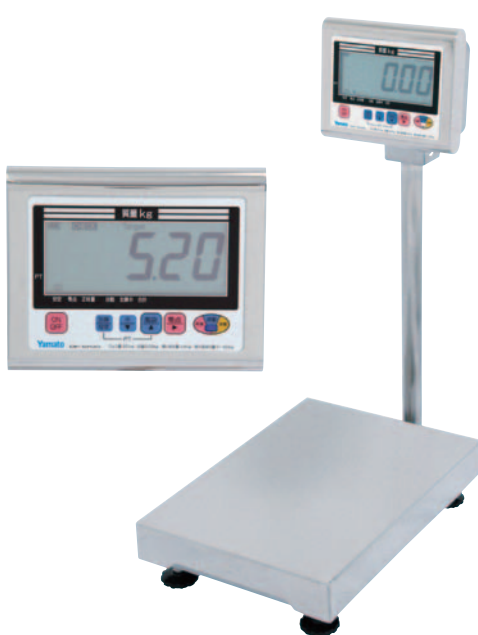
⑨防水デジタル台秤(検定品) DP-6700K-30 30kg(最小表示5g) ¥95,000 DP-6700K-60 60kg(最小表示10g) ¥95,000 DP-6700K-120 120kg(最小表示20g) ¥95,000 ●本体サイズ:350×605×795mm ●計量台サイズ:300×500mm ●本体重量:13kg ●電源:単1乾電池×4、又はACアダプター(別売¥4,000)

本体外形寸法:202mm×82mm×H37mm 重量:約250g 電源:アルカリ単4乾電池4本 電池寿命:約150時間(連続使用) 残留塩素測定範囲:0.00~2.00mg/l 最小表示0.01mg/l 表示方法LCD表示 pH範囲:5.8~8.08(測定環境) 導電率範囲:50~1000μS/cm(測定環境) 水温測定範囲:5℃~60℃ 測定対象:水道水 付属品:CLセンサー1本/DPD試験簡易セット(比色チャート、容器、試薬2包み×5) アルカリ単4乾電池4本 ●DPD法と同等の精度を有した無試薬のデジタル残留塩素計です。 (ただし、前回の校正から1週間経過、または50回の測定ごとに洗浄・校正が必要です。) ●約15秒の短時間測定。 ●センサー部は防水・耐熱(100℃まで)構造。 ●キャレーション(校正)機能付。 ●温度測定、測定メモリー、オートパワーオフ機能付。 ※校正はDPD法試薬式、または同等以上の精度を有する方法で行ってください。 ※冷泉・温泉・鉱泉・井戸水・アルカリイオン水は測定できません。