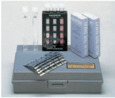
①DPD法残留塩素測定器(ブレイクス入) N-21195 ¥18,000 測定範囲:単位ppm(mg/l) 0.1、0.2、0.4、0.7、1.0、1.5、2.0、3.0 内 容:DPDコンバーター1、比色セル5、DPD法錠剤200錠

日医-21195~21197に使用する試薬はDPD法の開発者Dr.A.T.Pain(イギリス)が初めて成功した所要薬配合剤の錠剤で、被検水に投入攪拌するだけで、すぐ溶けて発色します。又、錠剤はヒートシールされているため保存が容易で3年以上も変質しないといわれています。