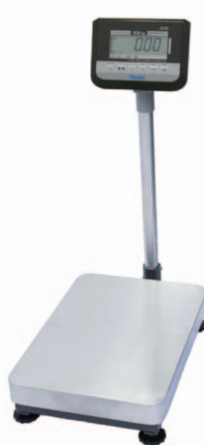
⑩デジタル台秤(検定品) DP-6900K-32 32kg(最小表示10g) ¥53,000 DP-6900K-60 60kg(最小表示20g) ¥53,000 DP-6900K-150 150kg(最小表示50g) ¥53,000 ●本体サイズ:354×634×784~804mm ●計量台サイズ:350×500mm ●本体重量:13kg ●電源:単1乾電池×4、又はACアダプター(別売¥4,000)