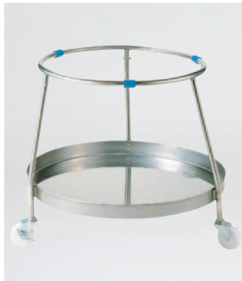
④18-8組立式丸型ざる置台(ドライ用) 392-E φ550(内径510)×630mm ¥50,000 ●材質:ステンレス/パイプφ19mm ※キャスターナイロンφ75mm×巾20mm (ストッパー2ヶ付)