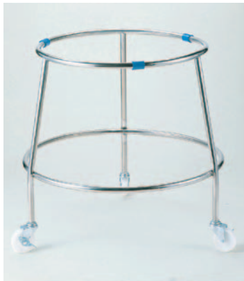
①丸型ざる置台 392 ¥29,800 φ550(内径510)×630mm ●材質:ステンレス/パイプφ19mm ※キャスターナイロンφ75mm×巾20mm (ストッパー2ヶ付)