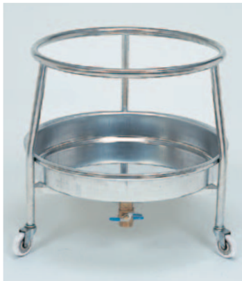
②丸型ざる置台(ドライ用) 392-B ¥95,000 φ600(内径550)×600mm ●材質:ステンレス/パイプφ25mm ※キャスターナイロンφ75mm×巾20mm (ストッパー2ヶ付)