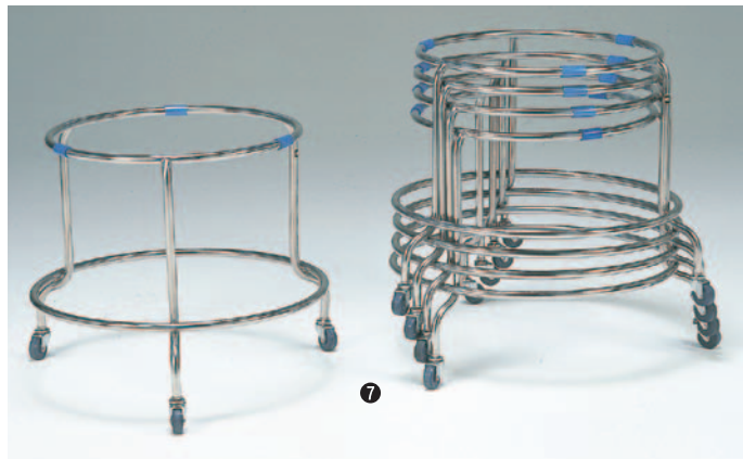
⑦丸型ざる置台 392-A SK-55型 φ550(内径500)×600mm ¥38,000 ●材質:ステンレス/パイプφ19mm ※ゴムキャスターφ50mm×巾20mmストッパー無し