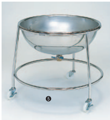
⑤ざる受け台車(ドライシステム用) 392-D φ650(内寸600)×H600mm ¥70,000 ●材質:ステンレス/パイプφ19mm ●排水バルブ付 ※キャスターナイロンφ75mm×巾20mm (ストッパー2ヶ付)