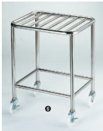
⑥角型ざる置台 393 500×400×460mm ¥47,500 393-A 500×400×600mm ¥53,000 ※キャスターナイロンφ75mm×巾20mm (ストッパー2ヶ付)パイプφ25mm 393-B ダブル 800×500×600mm ¥66,000 ※キャスターナイロンφ75mm×巾20mm (ストッパー2ヶ付)パイプφ19mm ●材質:ステンレス