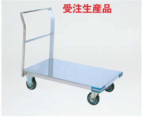
④運搬車 (L型) CL-9060 900×600×H825mm ¥70,000