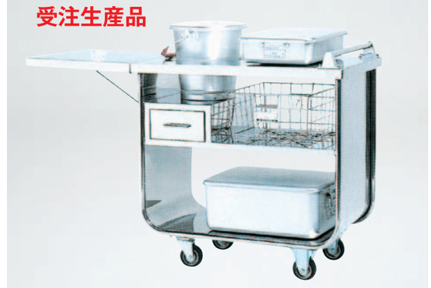
⑧運搬車 (一学級用) CC-9050 900×500×H850mm ¥150,000