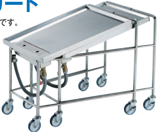
⑨パイルアップカート RB-20 675×620×H800mm ¥120,000 RB-30 775×620×H800mm ¥132,000 RB-40 875×700×H800mm ¥148,000 ※キャスター-φ100mm (自在4個) ※材質:SUS304ステンレス

ドライシステムに必須の水切りカートです。水切り槽を傾げるだけで収納でき、省スペース化が図れます。