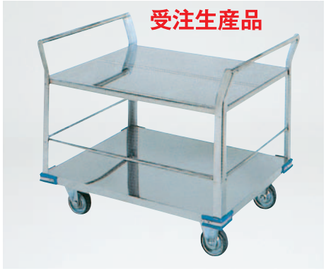
⑤運搬車 (廊下用) CP-9660 960×660×H825mm ¥120,000