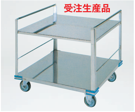
⑥運搬車 (リフト用) CL-9660 960×660×H825mm ¥110,000