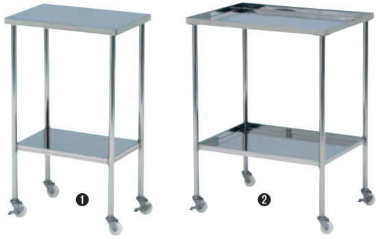
①ミニテーブルワゴン フラット N4530 450×300×H750mm 5.0kg ¥38,000 N6045 600×450×H750mm 7.3kg ¥40,800 ②ミニテーブルワゴン 皿型 U4530 450×300×H775mm 5.0kg ¥41,000 U6045 600×450×H775mm 7.3kg ¥44,800