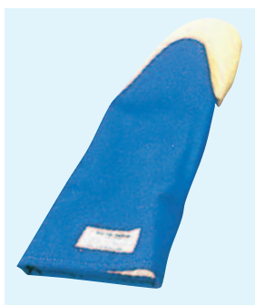
⑬ バンガード オープンプレスマット(高温用)(片手1枚) KS-01 ¥11,200 全長305mm KS-02 ¥12,200 全長380mm KS-03 ¥14,200 全長475mm 512Plus 12インチ 515Plus 15インチ 518Plus 18インチ ※耐熱温度:約480℃ ※洗えて衛生的です。