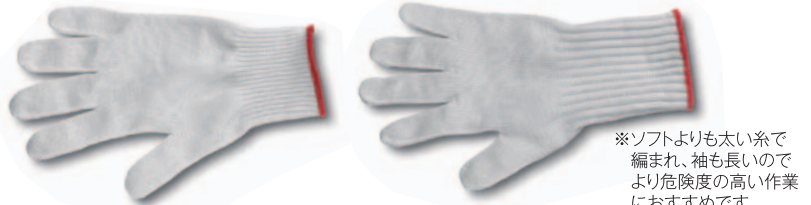
⑦ カットレジスタントグローブ(ソフト) (片手1枚) ¥2,400 送料実費