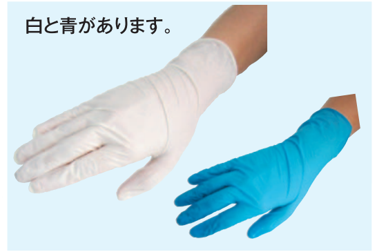
⑤ ポリエチレンエンボス手袋 200枚ロール 500枚ロール 84D-01 S ¥1,950 84D-04 S ¥4,900 84D-02 M ¥2,000 84D-05 M ¥5,000 84D-03 L ¥2,250 84D-06 L ¥5,700