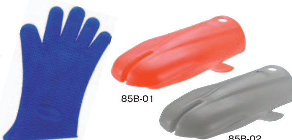
⑩ 業務用熱ブロック手袋(片手1枚) ST-500 全長330mm ¥2,000 ●材質:シリコン ※耐熱温度:220℃ ※大きい鍋などの使用も考慮したロングタイプ。 ※軍手をしたまま使用できる大きめフリーサイズ。