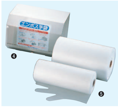
④ エンボス手袋ホルダー壁掛けタイプ 84E-01 340×220×H240mm ¥28,000 ※500枚ロール巻専用