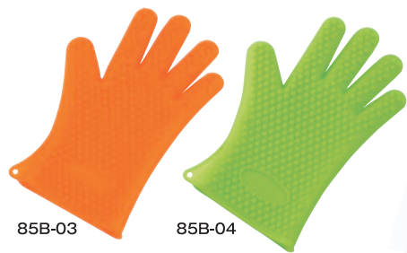
⑨ 5本指クッキンググローブ(片手1枚) 85B-03 オレンジ 185×275×30mm ¥1,200 85B-04 グリーン 185×275×30mm ¥1,200 ※耐冷温度:-30℃ 耐熱温度:220℃ ※約220℃に耐えるシリコン製なので熱い物の移動や熱湯の中へも入れられます。 ※食器洗浄機・食器乾燥機でも使用可能です。 ※左右兼用、男女兼用のフリーサイズ。 ※ハート型の凹凸は、両面に付いています。