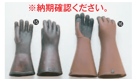
⑮ 弘進作業長手袋 85A-05 全長360mm 0.9mm厚ラバー ¥3,000 ※フリーサイズ