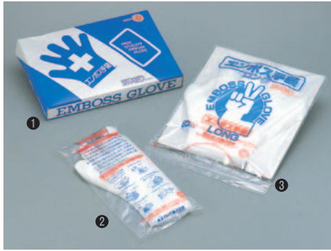
① ポリエチレンエンボス手袋30#(箱入) 84A-01 S 200入 ¥2,100 84A-02 M 200入 ¥2,100 84A-03 L 180入 ¥2,100