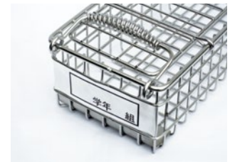
アルミニウムプレート1枚付