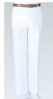
⑬ 430-50 (男子スラックス) ¥3,600 サイズ:70~130cm