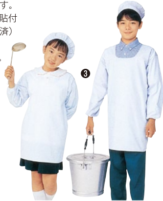
③ 394-90 給食衣・後マジックタイプ