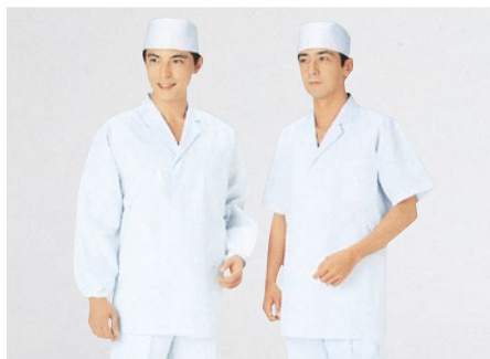
⑨ 310-30 (調理衣) (T/C) ¥3,500 サイズ:S・M・L・LL・3L・4L・5L・6L ⑩ 312-30 (調理衣) ¥3,400 サイズ:S・M・L・LL・3L・4L・5L・6L