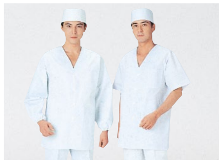
⑪ 320-30 (調理衣) ¥3,400 サイズ:S・M・L・LL・3L・4L・5L・6L ⑫ 322-30 (調理衣) ¥3,200 サイズ:S・M・L・LL・3L・4L・5L・6L