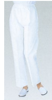
⑱ 810-40 (女子トレパン・総ゴム) ¥2,800 サイズ:8・9・10・11・12・13・14・15・16・17・18号