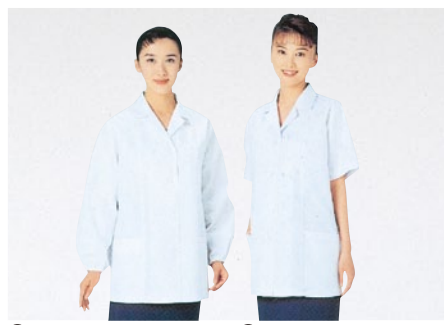
⑯ 335-30 (調理衣・白) ¥3,200 (T/C) 335-31 (調理衣・サックス) ¥3,100 サイズ:S・M・L・LL・3L・4L・5L ⑰ 337-30 (調理衣・白) ¥3,100 337-31 (調理衣・サックス) ¥3,100 サイズ:S・M・L・LL・3L・4L・5L