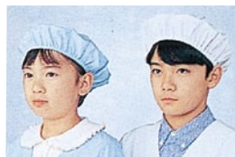
⑤ 392-90 (給食帽・白) 392-91 (給食帽・サックス) 392-92 (給食帽・ミントグリーン) 392-93 (給食帽・ピンク) 392-94 (給食帽・クリーム) 2枚入 ¥900 サイズ:フリー