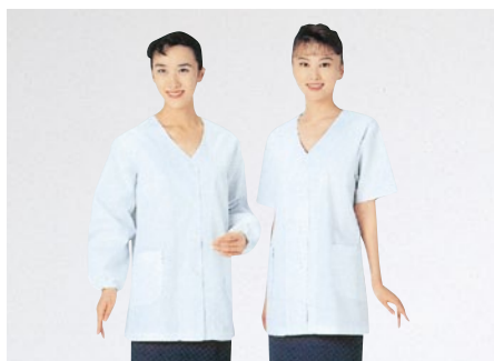
⑭ 330-30 (調理衣) ¥3,100 サイズ:S・M・L・LL・3L・4L・5L・6L ⑮ 332-30 (調理衣) ¥2,900 サイズ:S・M・L・LL・3L・4L・5L