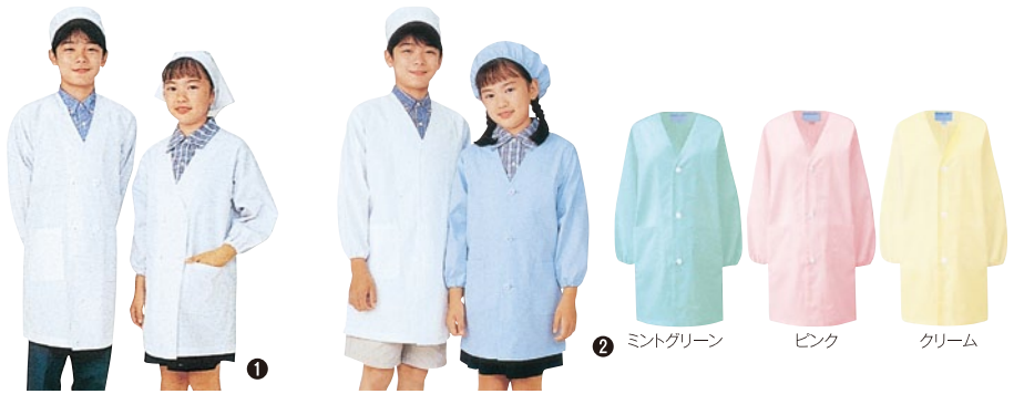
① 396-90 給食衣・ダブル型 ② 397-90(白)・91(サックス)・92(ミントグリーン)・93(ピンク)・94(クリーム) 給食衣・シングル型