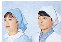
⑥ 477-90 (三角巾・白) 10枚入 ¥3,400 477-91 (三角巾・サックス) 10枚入 ¥3,400 サイズ:M(90×64cm)