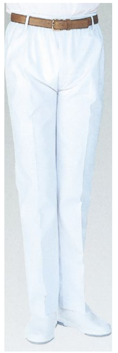
⑲ 800-40 (男子トレパン) ¥2,800 サイズ:8・9・10・11・12・13・14・15・16・17・18号