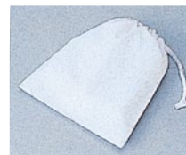
⑦ 393-90 (給食袋・白) 393-91 (給食袋・サックス) 393-94 (給食袋・クリーム) 2枚入 ¥800 サイズ:28×34cm