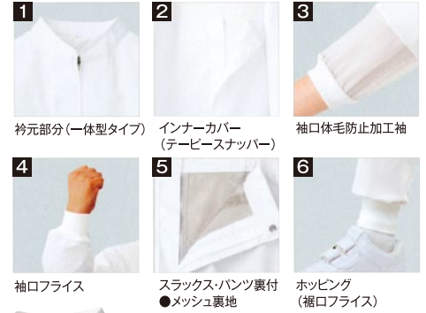
1 衿元部分(一体型タイプ) 2 インナーカバー(TEEピースナッパー) 3 袖口体毛防止加工袖 4 袖口フリス 5 スラックス/パンツ裏付 ●メッシュ裏地 6 ホッピング(裾口フリス)