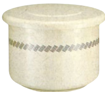
GBA-05 いなほ/アイボリー