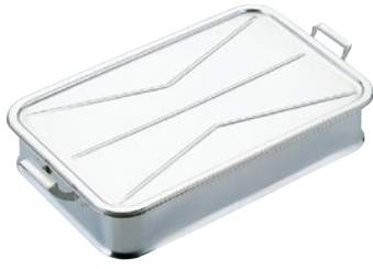
①抗菌給食バット手付 28K-E 本体24吋 外寸610×380×H130mm ¥16,600 28K-F フタ24吋 外寸630×400×H 15mm ¥6,900