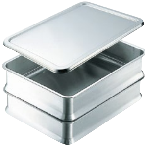
⑤抗菌スタッキング角バット 28K-H 本体 6枚取 外寸480×340×H105mm ¥7,600 28K-I 本体 10枚取 外寸350×265×H 85mm ¥4,800 28K-J フタ 6枚取 外寸490×350×H 10mm ¥3,500 28K-K フタ 10枚取 外寸360×275×H 10mm ¥2,900