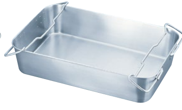
③抗菌運搬バット 28K-C 外寸600×380×H140mm ¥19,500 ※蓋は④28K-Fが合います。