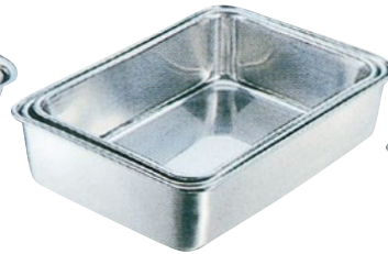
⑦抗菌深型組バット 29K-F 1号 外寸160×130×H70mm ¥2,000 29K-G 2号 外寸190×135×H74mm ¥2,300 29K-H 3号 外寸210×150×H75mm ¥2,600 29K-I 4号 外寸225×170×H77mm ¥3,100 29K-J 5号 外寸265×185×H78mm ¥3,900 29K-K 6号 外寸300×200×H80mm ¥4,600 29K-L 7号 外寸335×230×H86mm ¥5,300 29K-M 8号 外寸350×240×H87mm ¥5,900 29K-N 9号 外寸365×265×H94mm ¥6,300