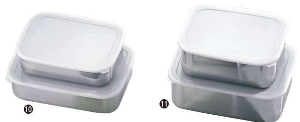
⑩18-8キッチンバット 287-PF 大 4.2ℓ 315×220×77mm ¥4,000 288-PF 中 3.1ℓ 265×195×70mm ¥3,100 289-PF 小 1.85ℓ 220×170×63mm ¥2,400