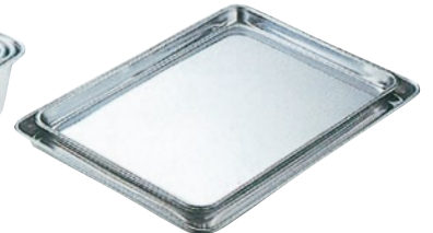
⑧抗菌ケーキバット 15K-2 9吋 外寸220×155×H15mm ¥1,600 15K-3 10吋 外寸265×180×H16mm ¥2,000 15K-4 11吋 外寸285×205×H17mm ¥2,400 15K-5 12吋 外寸325×230×H18mm ¥2,600 15K-6 14吋 外寸355×260×H19mm ¥3,500 15K-7 15吋 外寸385×285×H20mm ¥4,200 15K-8 16吋 外寸420×340×H22mm ¥5,300