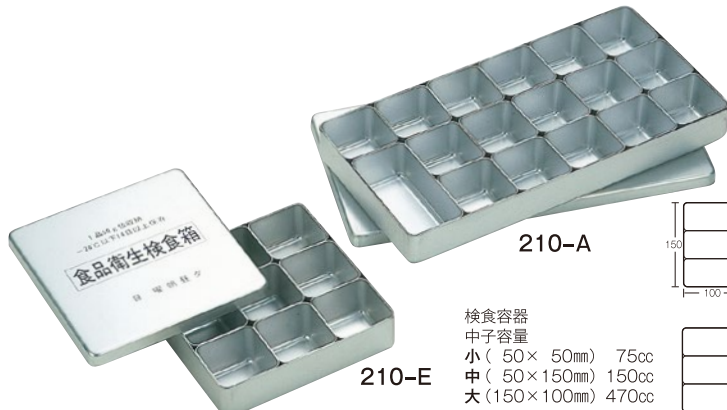
⑫検食容器 210-A A-17 300×150×38mm ¥9,000 シルバーアルマイト 210-B B-15 300×150×38mm ¥9,000 シルバーアルマイト 210-C C-9 300×150×38mm ¥9,000 シルバーアルマイト 210-D D-7 300×150×38mm ¥9,000 シルバーアルマイト 210-E 普及型 150×150×38mm ¥5,800 シルバーアルマイト ●日本食品衛生協会分