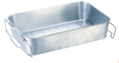
④抗菌水切り運搬バット 28K-B 外寸600×380×H140mm ¥20,000 ※蓋は④28K-Fが合います。