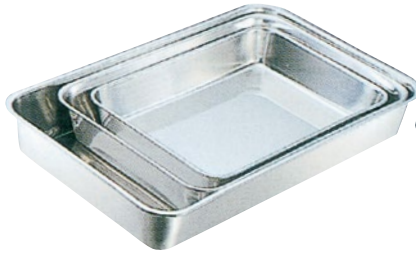
⑥抗菌角バット 29K-A1 3枚取 外寸590×425×H110mm ¥12,000 29K-A2 4枚取 外寸585×370×H 90mm ¥10,300 29K-A3 6枚取 外寸480×340×H 80mm ¥6,650 29K-A4 8枚取 外寸405×295×H 67mm ¥4,850 29K-A5 10枚取 外寸350×265×H 63mm ¥3,900 29K-A6 12枚取 外寸320×255×H 53mm ¥3,200 29K-A7 15枚取 外寸290×225×H 50mm ¥2,650 29K-A8 18枚取 外寸265×205×H 45mm ¥2,300 29K-A9 21枚取 外寸240×195×H 38mm ¥1,750 29K-A10 キビネ外 外寸210×170×H 30mm ¥1,450 29K-A11 手札型 外寸155×125×H 25mm ¥1,200