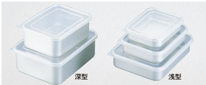
⑨PE蓋付バット 255-4 浅型ミニ 0.4ℓ 135×105× 40mm ¥1,200 255-5 浅型小小 0.55ℓ 155×120× 40mm ¥1,250 255-6 浅型小 0.7ℓ 174×134× 43mm ¥1,300 255-7 浅型中 1.1ℓ 206×156× 49mm ¥1,500 255-8 浅型大 2.0ℓ 246×190× 55mm ¥1,900 255-9 浅型特大 3.0ℓ 295×215× 65mm ¥2,700 255-10 深型ミニ 0.55ℓ 135×105× 55mm ¥1,300 255-11 深型小小 0.85ℓ 155×120× 60mm ¥1,350 255-12 深型小 1.2ℓ 174×134× 68mm ¥1,400 255-13 深型中 1.8ℓ 206×156× 78mm ¥1,700 255-14 深型大 3.2ℓ 246×190× 88mm ¥2,100 255-15 深型特大 4.8ℓ 295×215×100mm ¥3,100 ●材質:本体/シルバーアルマイト・蓋/ポリエチレン製 ●耐熱温度:70℃(蓋)