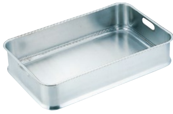
②抗菌給食バット・手穴明 28K-G 本体 24吋 外寸610×380×H130mm ¥16,000