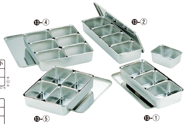
⑬18-8普及型調味料入バット(中子0号) ①21F-1 3ヶ入 328×148×H63mm ¥5,800 ②21F-2 4ヶ入(横長型) 432×148×H63mm ¥7,500 ③21F-4 5ヶ入(横長型) 545×152×H63mm ¥9,400 ④21F-5 6ヶ入 327×286×H63mm ¥11,200 ⑤210-F 田型 285×221×H63mm ¥8,600