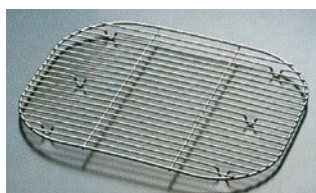
19120 (ホテルパンの中に入れるタイプ)