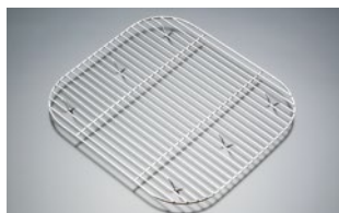
19230 (ホテルパンの中に入れるタイプ)