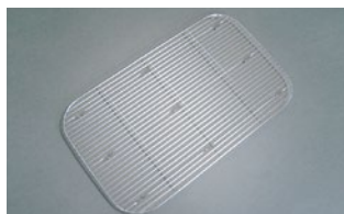
19000 (ホテルパンの中に入れるタイプ)