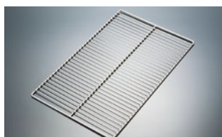
80110 (棚に掛けるタイプ)