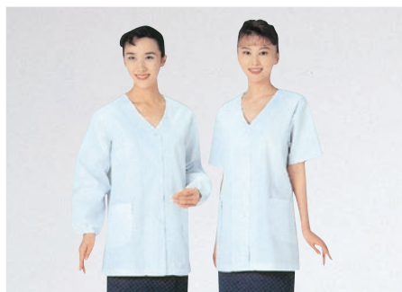
⑮ 330-30 (調理衣) ¥3,100 サイズ:S・M・L・LL・3L・4L・5L・6L ⑯ 332-30 (調理衣) ¥2,900 サイズ:S・M・L・LL・3L・4L・5L