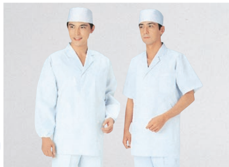
⑨ 310-30 (調理衣) (T/C) ¥3,500 サイズ:S・M・L・LL・3L・4L・5L・6L ⑩ 312-30 (調理衣) ¥3,400 サイズ:S・M・L・LL・3L・4L・5L・6L