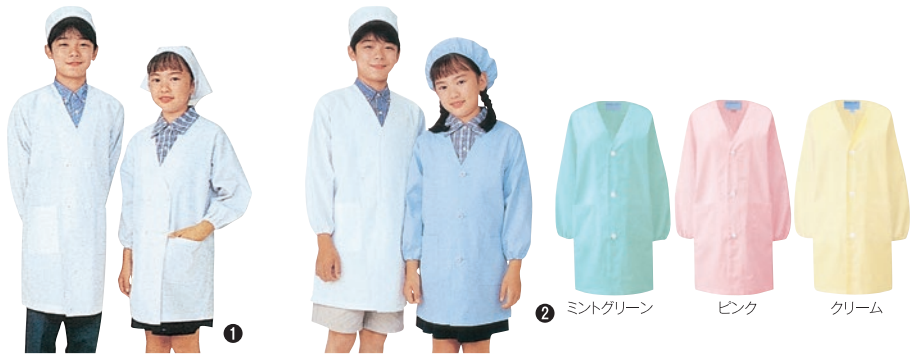
① 396-90 給食衣・ダブル型 ② 397-90 (白)・91 (サックス)・92 (ミントグリーン)・93 (ピン)・94 (クリーム) 給食衣・シングル型