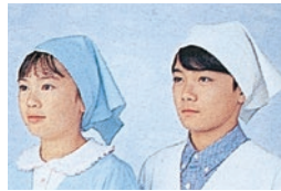
⑥ 477-90 (三角巾・白) 10枚入 ¥3,400 477-91 (三角巾・サックス) 10枚入 ¥3,400 サイズ:M (90×64cm)