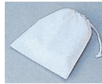
⑦ 393-90 (給食袋・白) 393-91 (給食袋・サックス) 393-94 (給食袋・クリーム) 2枚入 ¥800 サイズ:28×34cm