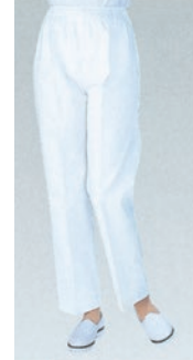
⑲ 810-40 (女子トレパン・総ゴム) ¥2,800 サイズ:8・9・10・11・12・13・14・15・16・17・18号