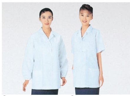
⑰ 335-30 (調理衣・白) 335-31 (調理衣・サックス) ¥3,200 (T/C) サイズ:S・M・L・LL・3L・4L・5L ⑱ 337-30 (調理衣・白) 337-31 (調理衣・サックス) ¥3,100 サイズ:S・M・L・LL・3L・4L・5L