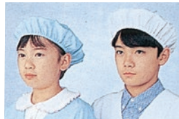
⑤ 392-90 (給食帽・白) 392-91 (給食帽・サックス) 392-92 (給食帽・ミントグリーン) 392-93 (給食帽・ピンク) 392-94 (給食帽・クリーム) 2枚入 ¥900 サイズ:フリー