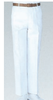
⑬ 430-50 (男子スラックス) ¥3,600 サイズ:70~130cm