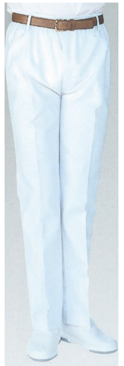
⑭ 800-40 (男子トレパン) ¥2,800 サイズ:8・9・10・11・12・13・14・15・16・17・18号