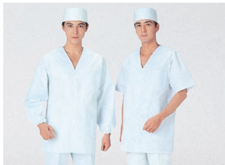
⑪ 320-30 (調理衣) ¥3,400 サイズ:S・M・L・LL・3L・4L・5L・6L ⑫ 322-30 (調理衣) ¥3,200 サイズ:S・M・L・LL・3L・4L・5L・6L