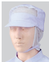
⑤484-44 2枚入 (丸天帽子・フロント・サイドメッシュ付) ¥2,600 サイズ:フリー(最大62cmまで)