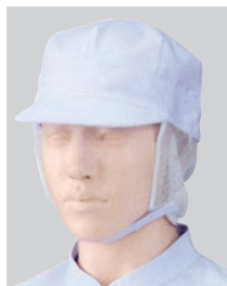
④484-43 2枚入 (八角帽子・サイドメッシュ付) ¥2,600 サイズ:フリー(最大61cmまで)