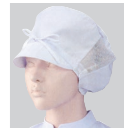
⑧484-30 2枚入 (作業帽子・メッシュ付) ¥2,800 サイズ:フリー(最大60cmまで)