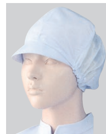
⑦482-32 2枚入 (女子帽子・6枚ハギメッシュ付) ¥3,000 サイズ:フリー(最大65cm)