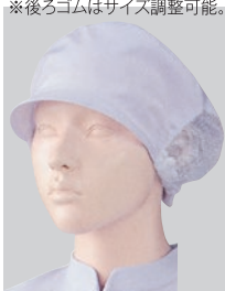
⑥482-33 2枚入 (女子帽子・後ろメッシュ付) ¥2,600 サイズ:フリー(最大65cm)