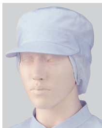
③475-49 2枚入 (丸天帽子・サイドメッシュ付) ¥2,600 サイズ:フリー