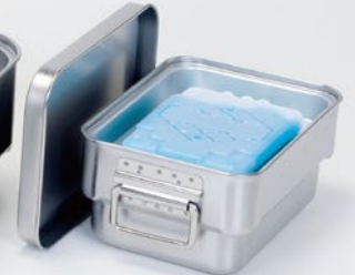
SMB-04+蓄冷剤セット(別売)