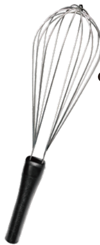
ブルー イエロー ピンク