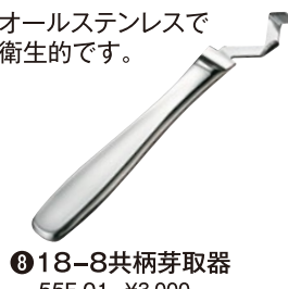
⑧ 18-8共柄芽取器 55F-01 ¥3,000 全長155mm 最中ハンドル