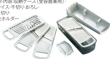
⑩ キッチンスライサー 野菜工房 KSY-01 ¥1,500 サイズ:本体235×85×H85mm 520g 材質:本体/ABS樹脂 フタ/AS樹脂 刃/ステンレス刃物鋼 セット内容:収納ケース(受容器兼用)・ スライス・千切り・おろし・ つま切り・ 安全ホルダー