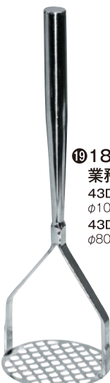
⑲ 18-8パイプ柄 業務用ポテトマッシャー 43D-01 大 φ100×全長335mm ¥4,400 43D-02 小 φ80×全長315mm ¥4,100