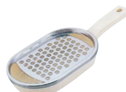
⑬ PCクイーンジャンボ おろし器 ¥1,600 57C-01 120×280×H40mm

食材最大幅:67mm 厚み調整:約0.5~3.0mm 材質: ●ABS樹脂(本体、 厚み調整板、つまみ、 クシ刃ケース) ●PS樹脂 (保護ホルダー) ●ステンレス (刃物、ネジ) ●真鍮 (インサートナット) 耐熱温度:70℃ スライサー本体、保護ホルダー、 クシ刃1.0mm、クシ刃2.5mm