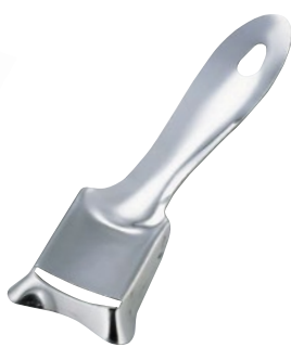
③ ステンレス製皮引き 55C-10 全長160mm ¥350