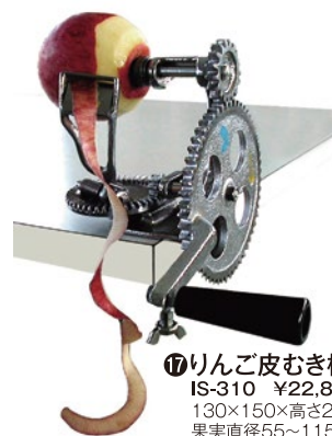
⑰ りんご皮むき機 IS-310 ¥22,800 130×150×高さ200mm 果実直径55~115mm位の梨・りんご専用。 別運