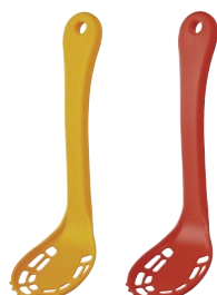
⑭ つぶせるすくえる スプーンマッシャー K-290 ¥1,050 66×221×74mm カラー:イエロー、レッド ●材質:ナイロン ●耐熱温度:200℃