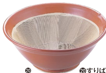
⑳ すりばち 71A-01 5号 φ160×H 70mm ¥780 71A-02 6号 φ190×H 80mm ¥1,300 71A-03 7号 φ220×H 90mm ¥1,800 71A-04 8号 φ250×H100mm ¥2,300 71A-05 9号 φ280×H120mm ¥2,600 71A-06 10号 φ310×H130mm ¥3,400 71A-07 11号 φ330×H140mm ¥5,500 71A-08 12号 φ370×H150mm ¥8,500 71A-09 13号 φ400×H160mm ¥13,000 71A-10 15号 φ460×H200mm ¥32,000