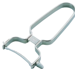
④ 18-8カーブピーラー 55C-09 ¥1,300 サイズ:刃渡り50mm 全長125mm ●材質:刃部/ステンレス刃物鋼