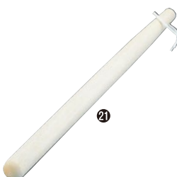
㉑ 木製太口すりこぎ棒(くるみ材) 71B-17 24cm ¥980 71B-20 39cm ¥1,580 71B-18 30cm ¥1,130 71B-21 45cm ¥1,780 71B-19 36cm ¥1,380