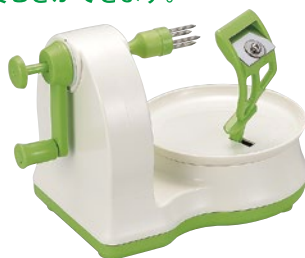
⑯ くるくるリンゴの皮むき KP-691 145×210×H145mm ¥3,400