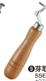
⑨ 芽取器 55E-01 φ27×136mm ¥1,750