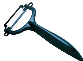
⑤ セラミックピーラー CP-NBK ¥1,000 サイズ:刃渡り40mm 76×145mm ●材質:刃部/ファインセラミック 柄部/ABS樹脂