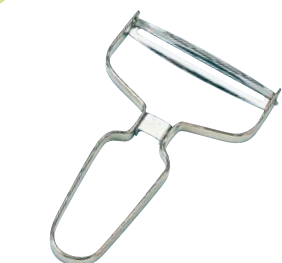
① 18-8ワイドピーラー AWP-60P ¥1,600 147×95×11mm ●材質:本体/18-8ステンレス 刃/ステンレス刃物鋼