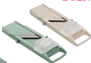
⑪ ベンリナークラシック NB-02 ¥3,500 サイズ:315×90×H25mm カラー:アイボリー、グリーン ※厚み調整(0.5~3mm)が出来ます。