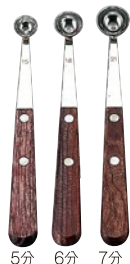
⑥ 18-8イモクリ ¥1,500 55G-21 3分 φ9×全長175mm 55G-22 4分 φ12×全長178mm 55G-23 5分 φ15×全長180mm 55G-24 6分 φ18×全長183mm 55G-25 7分 φ21×全長186mm 55G-26 8分 φ24×全長188mm 55G-27 9分 φ27×全長190mm 55G-28 10分 φ30×全長192mm