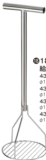
⑱ 18-8パイプ柄 給食マッシャー 43B-04 小 φ120×全長350mm ¥12,200 43B-05 中 φ150×全長520mm ¥13,300 43B-06 大 φ180×全長580mm ¥14,200 43B-07 特大 φ180×全長800mm ¥15,000