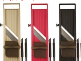
⑫ キレルワ KRW ¥6,000 サイズ:320×92×H28mm(つまみ部除く) 重さ:約283g(本体212g、保護ホルダー26g、 クシ刃1.0mm、クシ刃2.5mm) カラー:サンド、マゼンタ、ブラック

食材最大幅:67mm 厚み調整:約0.5~3.0mm 材質: ●ABS樹脂(本体、 厚み調整板、つまみ、 クシ刃ケース) ●PS樹脂 (保護ホルダー) ●ステンレス (刃物、ネジ) ●真鍮 (インサートナット) 耐熱温度:70℃ スライサー本体、保護ホルダー、 クシ刃1.0mm、クシ刃2.5mm