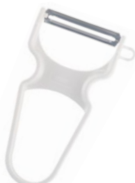
② リッター皮むき (ステンレス刃) 55C-05 全長110mm ¥700