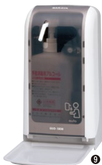
⑨自動手指消毒器 1ℓタイプ GUD-1000-PHJ 147×101×H268mm ¥11,550 ※アルカリ電池単1型4本使用 (別売) ※専用ボトルトレイ (GUD-T ¥680) は別売です。