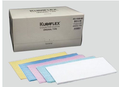
⑧クラフレックス カウンタークロス60枚入 90C-01 610×350mm ¥3,500 ●材質:レーヨン100% ※カラー:ホワイト・グリーン・ピンク・ブルー・イエロー ※汚れが落ち易く、乾燥が早いので、衛生的です。 ※すぐれた吸水性。 ※洗濯・漂白・殺菌が可能です。 ※カラーバリエーションで使い分け可能。 ※レーヨン100%なので手にも食品にも安心です。