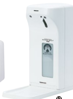
⑬自動噴射式 手指消毒器 ハンディミスト HMIⅡ ¥21,000 135×250×H308mm 約1kg (乾電池含む、ボトルは含まず) ※方式:光センサー作動による自動吐出方式 ※電源:単二形乾電池×2個付 ※薬液、ボトルは付属しません。 ●ハンディミスト共通ACアダプター (3V) (別売)