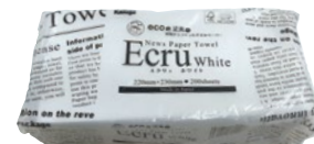
④エクリュホワイトペーパータオル レギュラー200枚 (1ケース20束入) KA200 230×220mm ¥6,280 新聞再生紙100% (国産) しっかり吸収の丈夫な紙質。