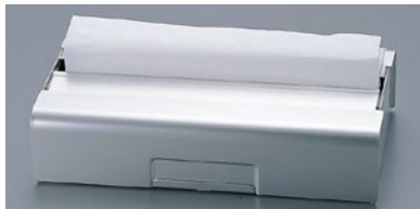
①クレシアハンドタオル アルミディスペンサー CL100 240×130×H60mm ¥5,800 ●水や油污れ、熱にも強いアルミ合金製 ●狭い場所に取付けできるコンパクトなサイズ ●クレシアハンドタオルが約100枚入りです