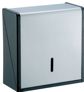
⑥ステン紙タオル ホルダーL TL-600 ¥8,800 288×136×H300mm ●材質:ステンレス、ABS樹脂 ●重量:約1.4kg ●両面テープ (30×50mm・4枚入、ねじ付) ●一度に600枚収納可能 ●小判・中判の紙タオルに対応