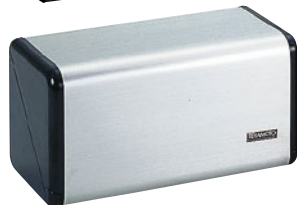
⑦ステン紙タオル ホルダー TS-200 ¥6,580 264×135×H135mm ●最大セット枚数:200枚 ●材質:ステンレス、ABS樹脂 ●重量:約0.8kg