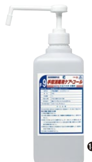
⑭手指消毒用ケアコール ポンプ付 1ℓ HMIⅢ ¥2,800 ※成分:塩化ベンザルコニウム0.05w/v・ エタノール・グリセリン ●指定医薬部外品 ●保湿剤配合 ●エタノール59w/w% 〔「ハンディミストHMIⅡ」にも使用できます〕