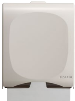
⑤クレシア ハンドタオル ディスペンサー スリム400 CM400S O4150中判用 244×134×H298mm ¥4,400 ●最大セット枚数:400枚 ●材質:ABS樹脂 ●クレシアハンドタオルが約400枚入りです。