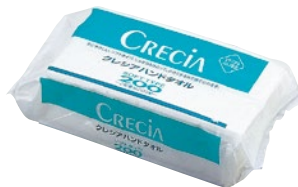
③クレシア ハンドタオル ソフトタイプ200 30束 EF200 230×218mm ¥8,000 平判2ツ折 ロット(200枚×30束)になります。